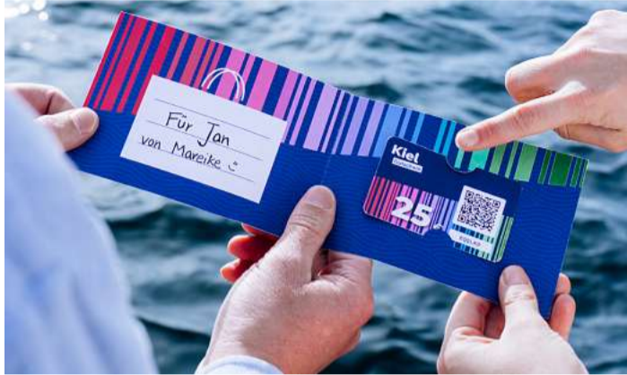
Mit dem Kielgutschein hat man immer das passende Geschenk.

Einstieg für alle, die Lust und Interesse haben, sich der Herausforderung dieser faszinierenden Sportart zu stellen. Weitere Informationen, Trainingspläne und die Möglichkeit zur Online-Anmeldung gibt es unter: www.kieltriathlon.de